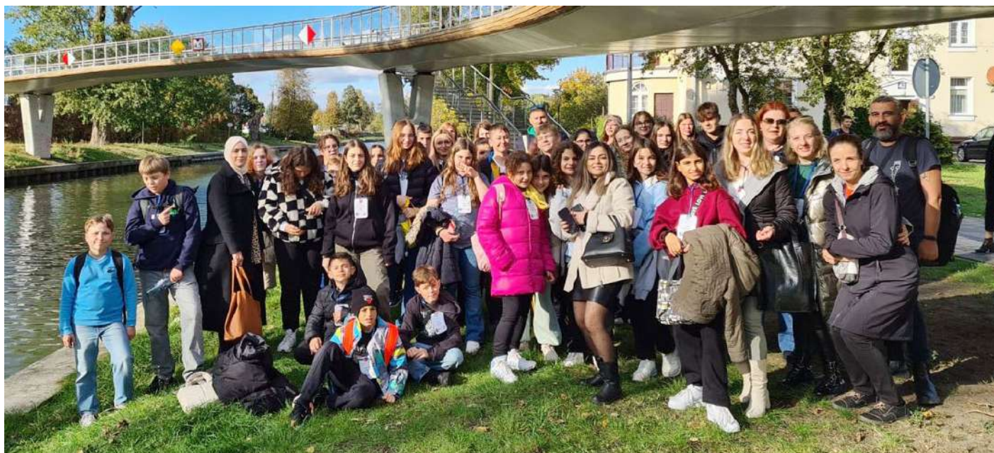
Zwiedzając Giżycko uczestnicy międzynarodowego projektu zawędrowali pod kładkę na kanale Łuczańskim