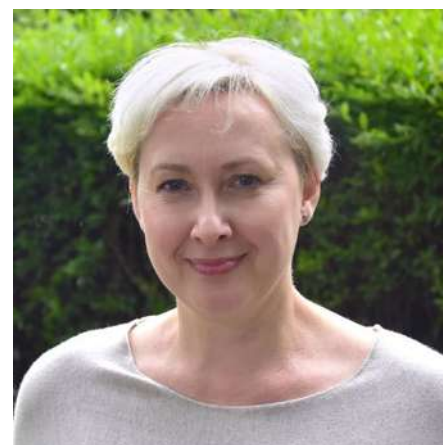
Fot. Bogusław Zawadzki