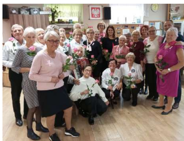
Uczestnicy spotkania z okazji Dnia Różowej Wstążki w giżyckim Klubie Seniora